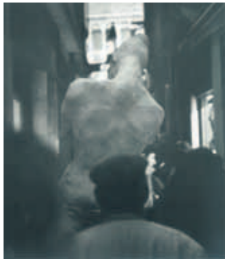
Gegenwart. Reste antiker Tempelreste von Ingrid von Kruse. Foto: I. v. Kruse

Sechs Fotografen aus den westlichen und östlichen Bundesländern sprach sie an. Gemeinsam traf man eine Auswahl