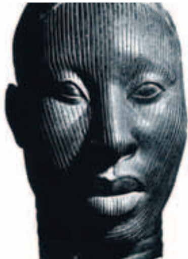
Geschichte. Afrikanischer Bronzekopf von Hannes Kilian.