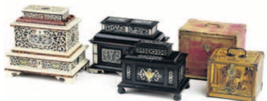
Kostbares Kunsthandwerk. Eine Auswahl von Drunkassetten aus dem Süddeutschen, Augsburg oder Nürnberg (1570 bis 1650).

Laues Schwerpunkt liegt im 16. und 17. Jahrhundert. Sein Lieblingswerbeprospekt bezieht sich auch auf die Erst- und Vorbesitzer seiner Schätze: „Wunder kann man sammeln.“ Das Wundern,