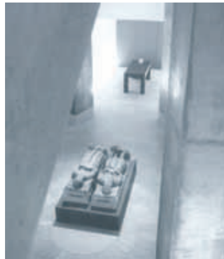
Pathos. Ansicht aus dem Bode-Museum von Barbara Klemm.

von etwa 40 Schwarz-Weiß-Arbeiten. Der jüngste Fotograf ist Torsten Warmuth. Der 1968 geborene Berliner hat in seinem sechs Meter langen Tableau aus 14 Einzelaufnahmen Passanten in unterschiedlichen Belichtungszeiten fotografiert. Eilig scheinen sie einem unbekanntem Ziel zuzustreben. Man schaut ihnen zu und fühlt sich an Edward Muybridges fo-