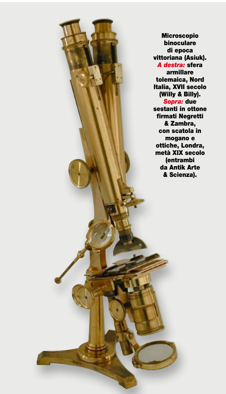
Microscopio binoculare di epoca vittoriana (Asiuk). A destra: sfera armillare tolemaica, Nord Italia, XVII secolo (Willy & Billy). Sopra: due sestanti in ottone firmati Negretti & Zambra, con scatola in mogano e ottiche, Londra, metà XIX secolo (entrambi da Antik Arte & Scienza).