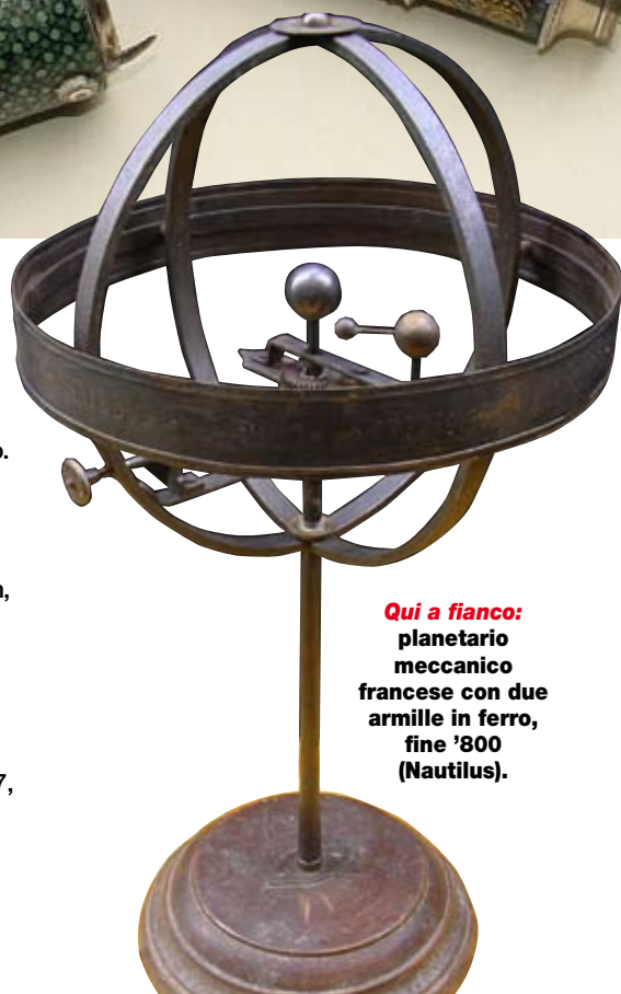
Qui a fianco: planetario meccanico francese con due armille in ferro, fine '800 (Nautilus).

Willy & Billy , corso Re Umberto 17, Torino. Tel. 011-547524.