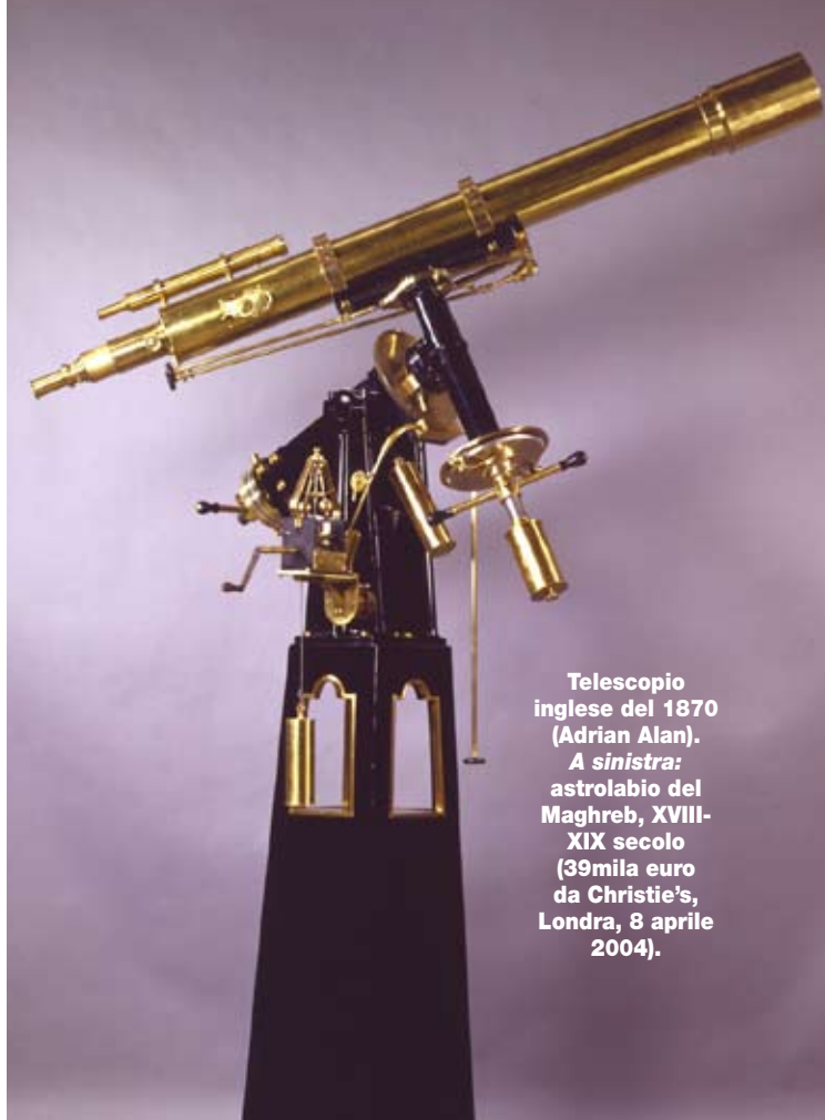
Telescopio inglese del 1870 (Adrian Alan). A sinistra: astrolabio del Maghreb, XVIII-XIX secolo (39mila euro da Christie's, Londra, 8 aprile 2004).

in 360 gradi, corrispondenti ai giorni dell'anno, e ciascun grado in 60 minuti (in questo modo si poteva prendere nota del trascorrere delle stagioni); gli scienziati alessandrini inventarono l'anello equinoziale (che indicava l'equinozio di primavera e d'autunno), il quadrante murario (che calcolava l'altezza del sole a mezzogiorno) e la cosiddetta "regola di Tolomeo" (usata per misurare gli angoli e seguire il movimento degli astri). Si deve agli astronomi islamici, invece, l'invenzione dell'astrolabio planisferico: un disco circolare in ottone, con una rappresentazione della volta celeste, sul quale ruotava una griglia che indicava la posizione di alcune stelle. Creato per indicare ai musulmani le ore della preghiera, consentiva di localizzare la posizione del sole, dei pianeti e delle stelle e per secoli è stato il principale strumento di navigazione. Gli scien-