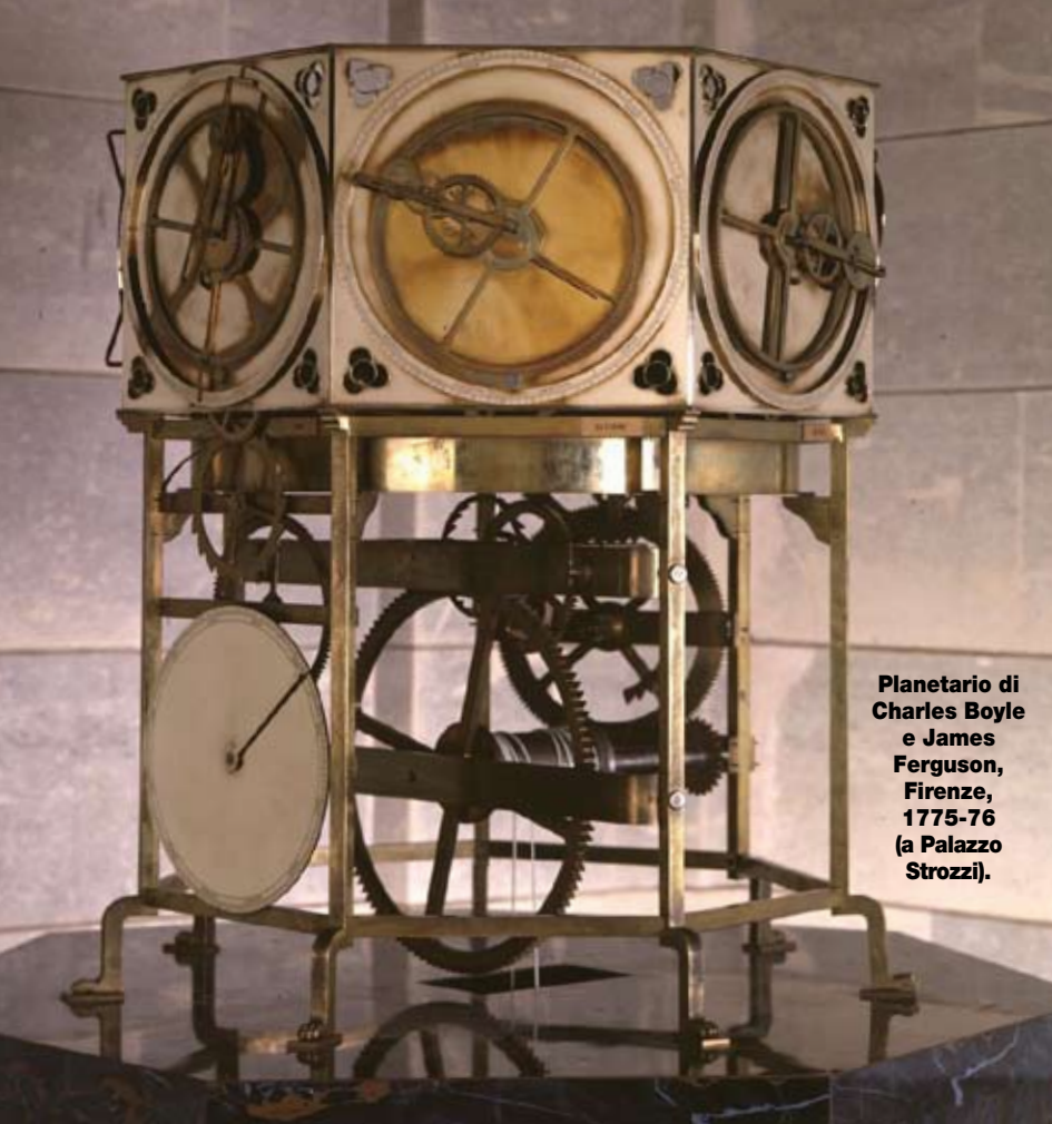
Planetario di Charles Boyle e James Ferguson, Firenze, 1775-76 (a Palazzo Strozzi).