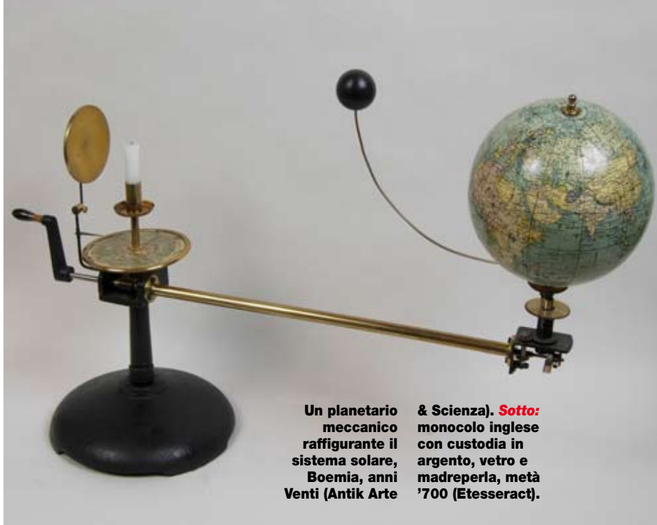
Un planetario meccanico raffigurante il sistema solare, Boemia, anni Venti (Antik Arte & Scienza). Sotto: monocolo inglese con custodia in argento, vetro e madreperla, metà '700 (Etesseract).

Il collezionismo di strumenti scientifici prese avvio già alla fine del XIV secolo, ma fu il Rinascimento l'età d'oro delle grandi raccolte. Uno dei primi mecenati, la cui collezione comprendeva orologi e apparecchiature meccaniche, fu Jean de Berry (1532-1592), duca di Borgogna; mentre l'imperatore Rodolfo II (1552-1612) accolse alla propria corte di Praga l'illustre Erasmus Habermel, i cui strumenti sono considerati tra i più preziosi d'ogni tempo. Nello stesso periodo la corte dei Medici a Firenze primeggiava nel patrocinio del sapere e dava protezione a scienziati e inventori di fama, tra cui Galileo. Oggi il collezionismo di strumenti scientifici è legato soprattutto al mondo della nautica e delle imbarcazioni d'epoca. Tra i pezzi più richiesti, ci sono i cannocchiali (quotati da 300 a 10mila euro, a seconda della dimensione e del periodo di realizzazione), i sestanti, le bussole e gli strumenti di carteggio. Più difficili da trovare, le sfere armillari (esemplari francesi in cartapesta del XVIII-XIX secolo si acquistano a partire da 10mila euro) e i planetari meccanici (che vanno da 800 euro per i modelli novecenteschi a 4mila euro per i più antichi). Rari, invece, gli astrolabi e i globi celesti cinque-secenteschi, solo occasionalmente proposti nelle aste specializzate, come quelle del Dorotheum di Vienna a cifre sostenute (fino a 100mila euro). ◇