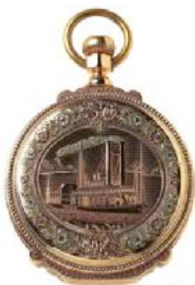
05 浮雕图案是一艘蒸汽船在美国密西西比河中穿行，表壳周边的花朵则是用多色金雕刻而成的。此表折射出万国表原本的美国血统，据馆方介绍它还是万国表厂生产的第一只表。