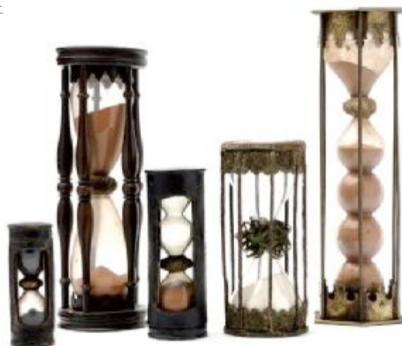
11 五件来自德国和法国的沙漏，制作于17至18世纪