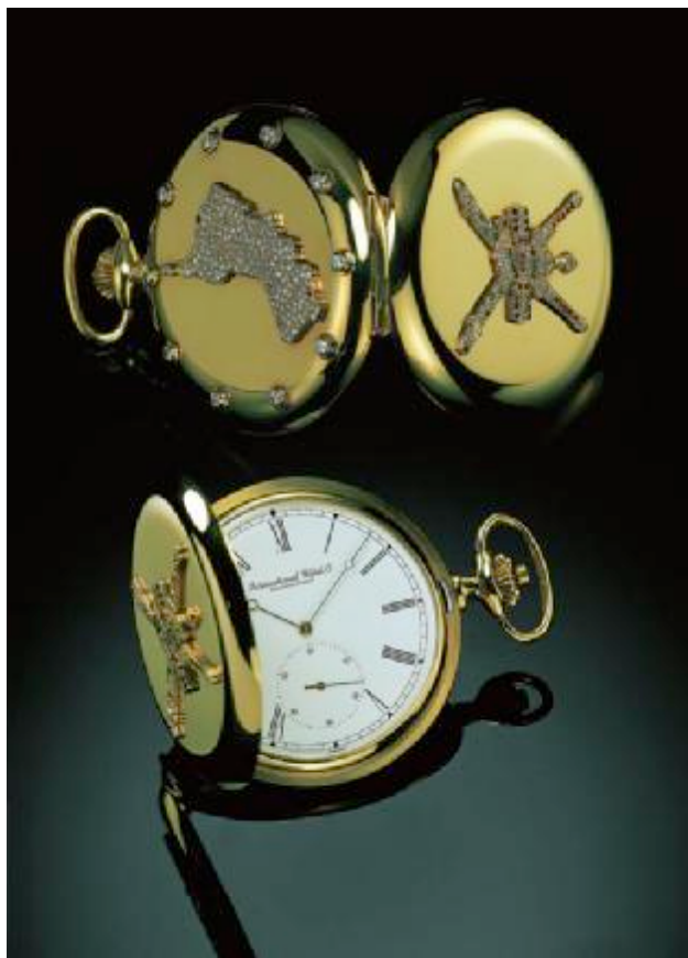
20世纪80年代，万国表为阿拉伯世界制造了这款金表。表盖正面上为代表伊斯兰教君主地位的徽章，表盖背面则是以钻石镶嵌而成阿曼地图。