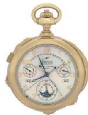
03 百达翡丽博物馆所藏世界怀表之王——89型怀表