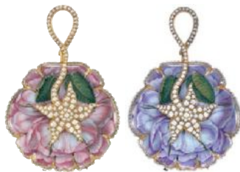
02 百达翡丽博物馆所藏1815年左右Piguet & Meylan专为中国宫廷制造的玫瑰花形怀表（一对）