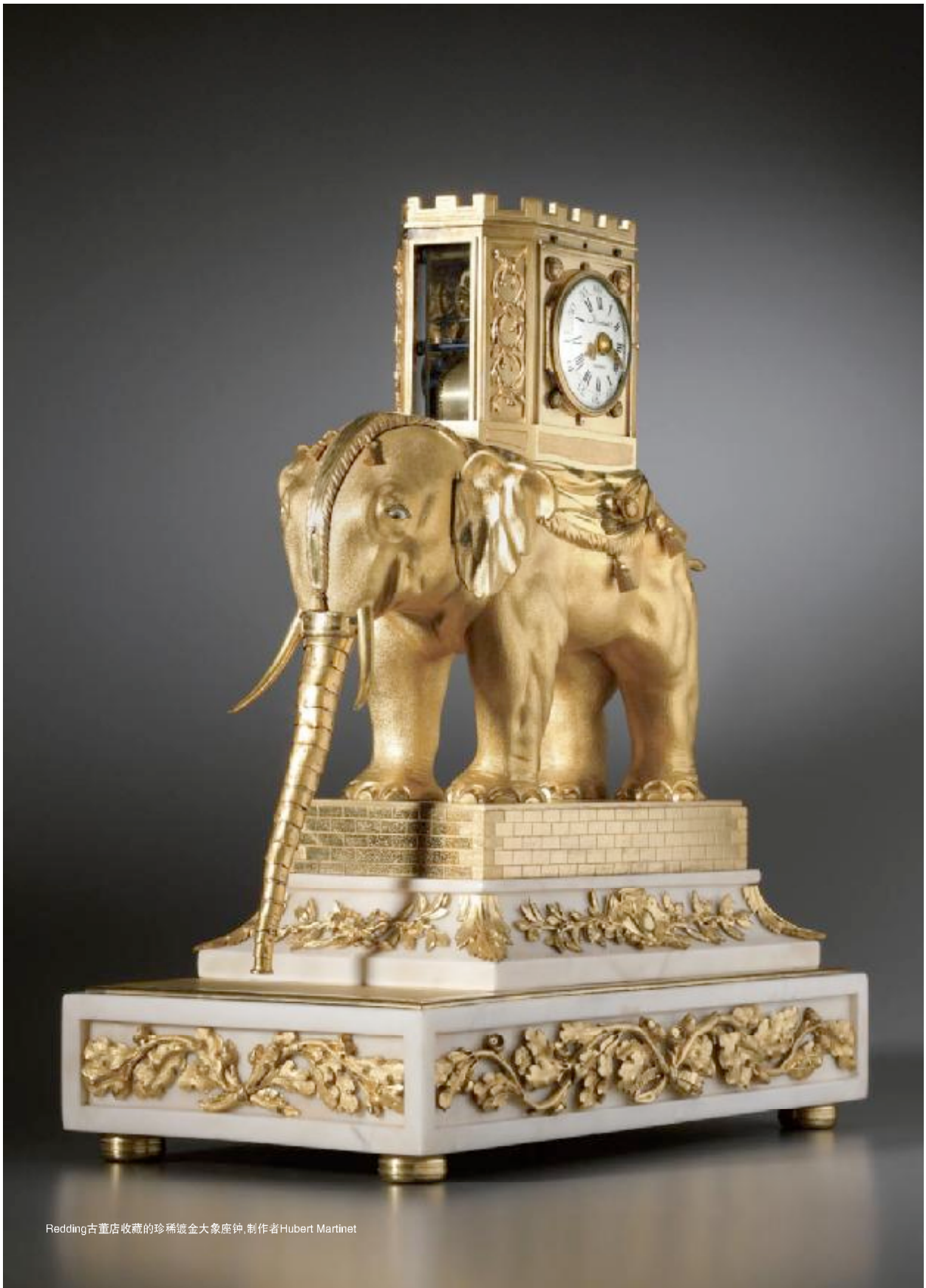
Redding古董店收藏的珍稀镀金大象座钟, 制作者Hubert Martinet