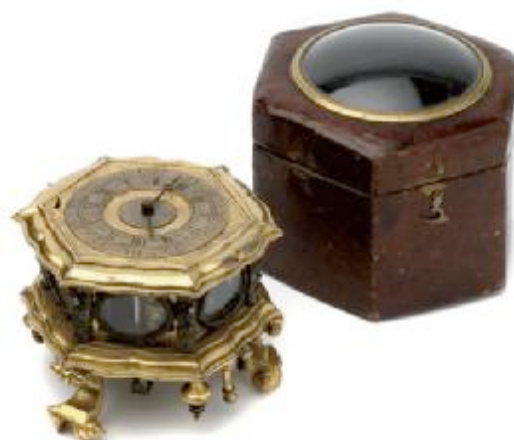
06 六角形的台钟，以及原配皮盒，出自Gottfried Poy，大约在1720至1730年代制作于伦敦。