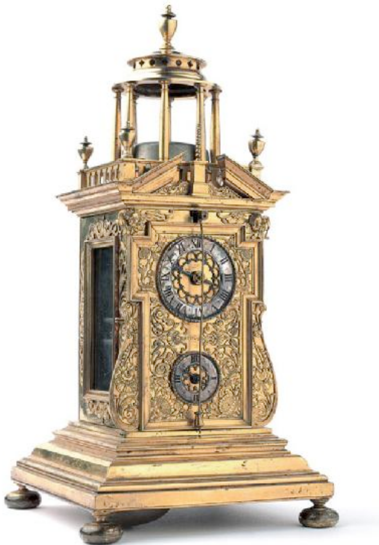
01 炮塔形钟，瑞士制钟师Carl Joseph Käppelin在1690年制作