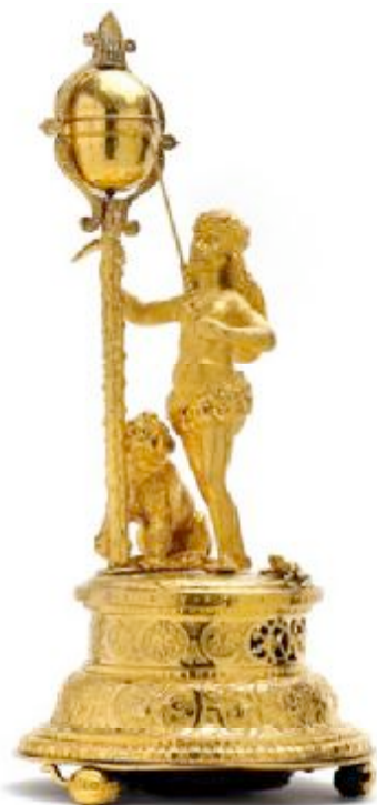
10 一座稀有的文艺复兴时期钟，伴有一位土著女性雕塑，大约是1590年代在德国南部制作