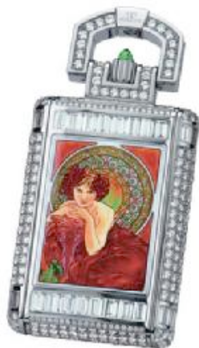
07 积家博物馆馆藏，为文莱苏丹特制的珐琅钻石怀表