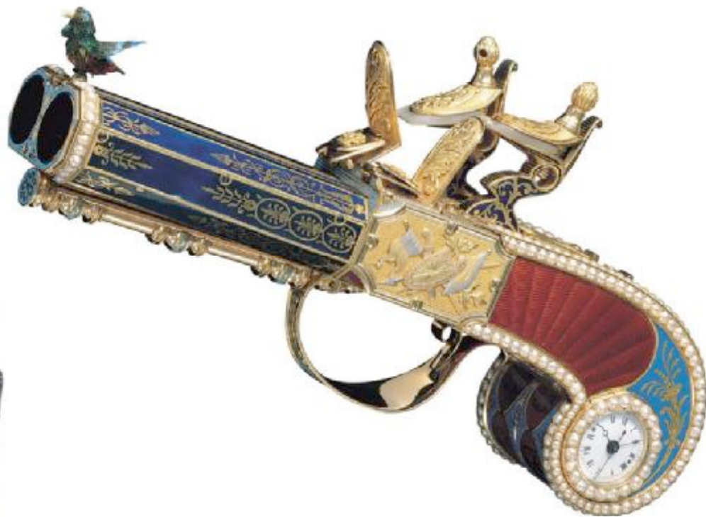
09 百达翡丽博物馆藏1810年产手枪飞鸟钟