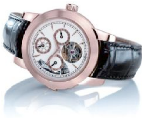
08 国际钟表博物馆馆藏芝柏“歌剧院二号”超复杂功能表