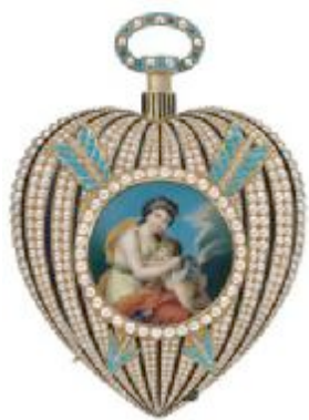
04 百达翡丽博物馆所藏1820年Piguet & Meylan产心形音乐报时表